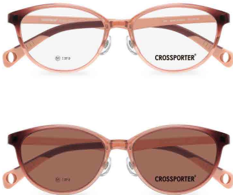
クリップ偏光サングラス

SIZE 51□16-142 ¥37.0 MATERIAL ポリフェニルサルフォン(PPSU) (0160)