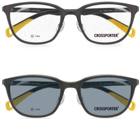
クリップ偏光サングラス

SIZE 52□18-142 ¥38.9 MATERIAL ポリフェニルサルフォン(PPSU) (0160)