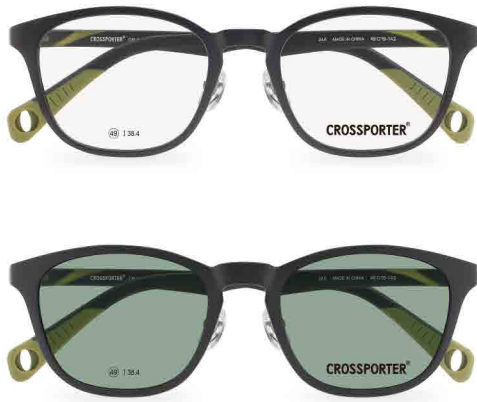
クリップ偏光サングラス

SIZE 49□19-142 ¥38.4 MATERIAL ポリフェニルサルフォン(PPSU) (0160)