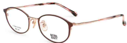
COL. 1 ピンクゴールド (リム) ワインレッド