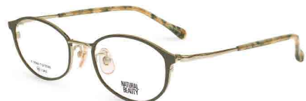
COL. 2 ホワイトゴールド (リム) ダークブラウン