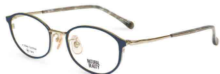
COL. 3 ホワイトゴールド (リム) ダークネイビー