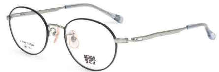
COL. 3 シルバー (リム) ブラック