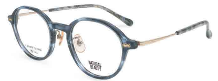
COL. 3 ネイビーササ・ホワイトゴールド