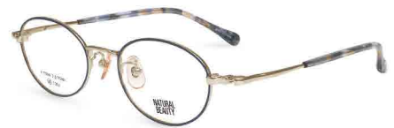
COL. 2 ホワイトゴールド (リム) グレーブルー