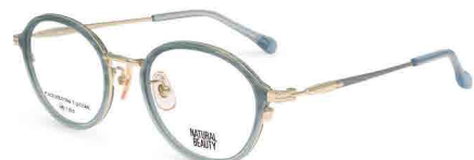
COL. 1 ハーフグレーササ・ホワイトゴールド (ポイントカラー) グレーブラウン