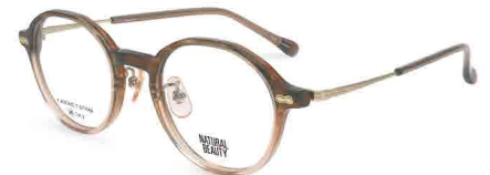
COL. 2 ハーフブラウンササ・シャーリングホワイトゴールド