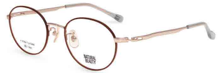
COL. 1 ピンクゴールド (リム) ルビーレッド