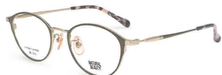
COL. 2 ホワイトゴールド (リム) ココアブラウン