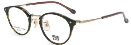
COL. 2 ブラウンデミ・シャーリングホワイトゴールド