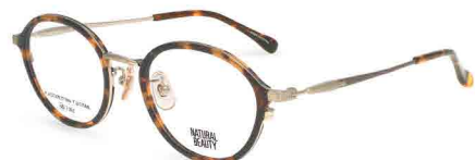
COL. 3 ブラウンデミ・シャーリングホワイトゴールド (ポイントカラー) ココアブラウン