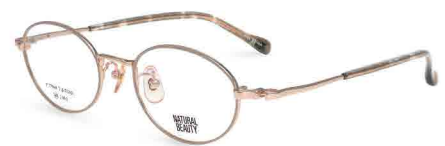
COL. 3 ピンクゴールド (リム) グレージュ