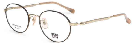
COL. 2 ホワイトゴールド (リム) ブラウン