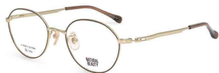
COL. 3 ホワイトゴールド (リム) ダークブラウン