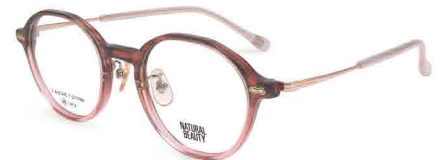
COL. 1 ハーフピンクササ・ピンクゴールド