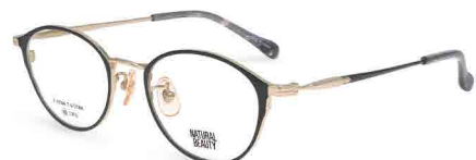
COL. 3 ホワイトゴールド (リム) ブラック