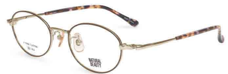
COL. 1 ホワイトゴールド (リム) ブラウン