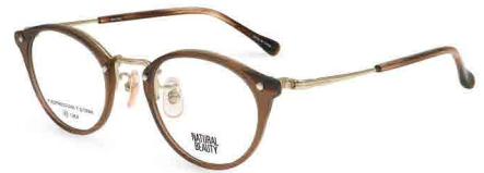
COL. 1 ココアブラウン・ホワイトゴールド