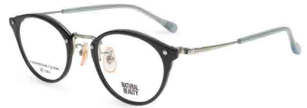
COL. 3 ブラック・シルバー