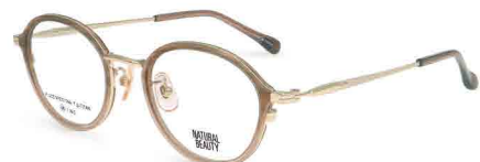
COL. 2 ハーフブラウンササ・ホワイトゴールド (ポイントカラー) ライトブラウン