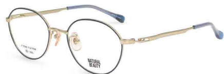
COL. 2 ホワイトゴールド (リム) グレーブルー