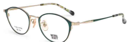
COL. 1 ホワイトゴールド (リム) ディープグリーン