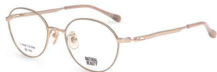
COL. 1 ピンクゴールド (リム) ピンクベージュ